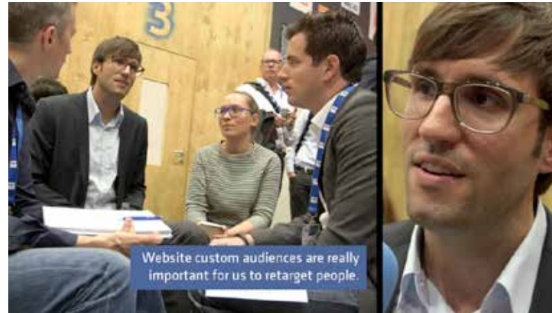
Impressionen von der dmexco 2014 für Facebook DACH & Nordics

Dieses Angebot richtet sich an Agenturen, die qualitativ hochwertige und ansprechend produzierte digitale Inhalte für ihre Kunden benötigen. —